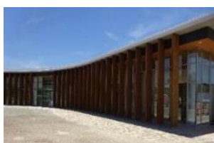
④西口案内所・休憩所