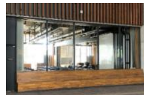
③地球市民交流センター(要予約)