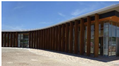
④西口休憩所・案内所