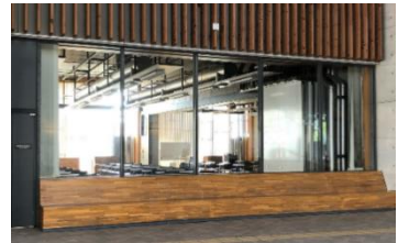
③地球市民交流センター(要予約)